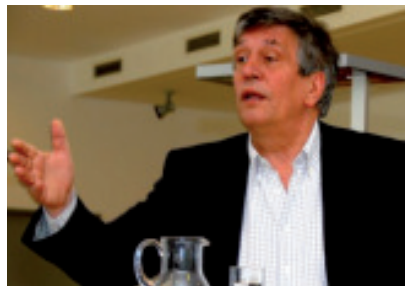
Dr. Hermann Scheer, Präsident von EUROSOLAR